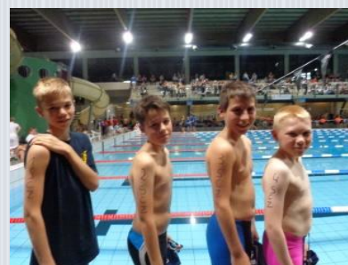
Aflossing 11-12 jarigen