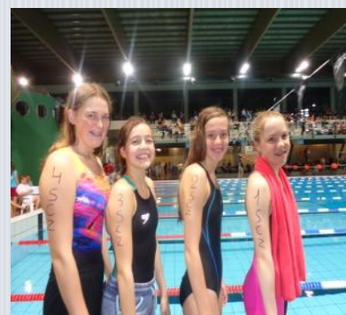
Aflossing 13-14 jarigen