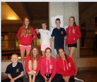
Zwemmers korte afstand

zelfs jonge haai-tijden bij elkaar. Ook de drie aflossingsploegen deden het goed. In de open categorie behaalde SCZ de 8e plaats op de 4X 100 vrije slag, de 11-12 jarige jongens behaalden de 4e plaats op de 4X 100 vrije slag. Ook onze 13-14 jarige meisjes deden het super, zij behaalden de 3e plaats op de 4X100 meter wisselslag en de 4X200 meter vrije slag.