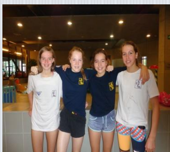
Aflossing open categorie